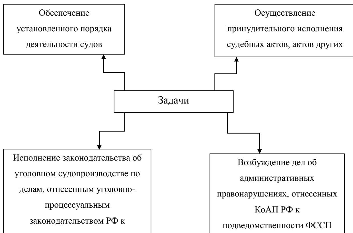
Рисунок 3 – Задачи Федеральной службы судебных приставов РФ

Допускается использовать рисунки со статистическими данными, оформленными в виде диаграмм; такие рисунки должны быть подписаны с указанием источника ( Например: по данным ФССП).